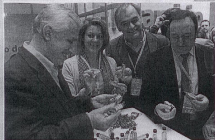
Javier Arenas, Dolores de Cospedal, Esteban González Pons y Pedro Sanz