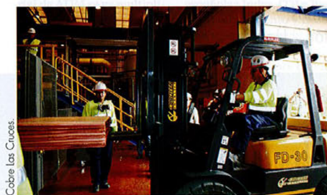
Cobre las Cruces

¿China? Ahí yace un gigante dormido. Déjenlo dormir! Para cuando despierte él moverá el mundo". Lo dijo Napoleón en el siglo XIX, y ahora estamos comprobando lo acertadas que fueron aquellas palabras. China es actualmente una de las principales referencias para el sector andaluz del cobre, pues este país, en vías de desarrollo, consume un 40% de la producción mundial