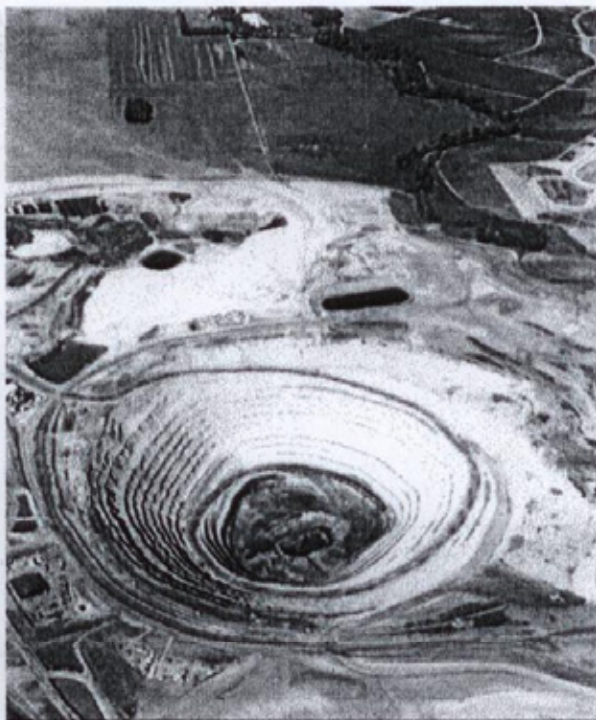
La mina Cobre Las Cruces.

Con unos ingresos conjuntos de unos 35.000 millones dólares y una producción anual de 1,3 millones de toneladas en 2018, el nuevo grupo "está a punto de convertirse en uno de los cinco productores de cobre más grandes del mundo". "La compañía será una de las empresas de cobre con mayor crecimiento, con un incremento anual previsto de más del 20% durante al menos la próxima dé-