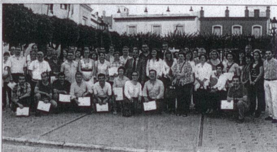
Beneficiarios del programa de ayudas 2012 con los alcaldes de Gerena, Guillena, Salteras y La Algoroba.