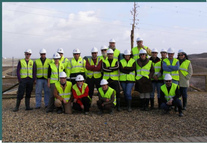
El grupo de visitantes acompañados por el equipo de Medio Ambiente de Cobre Las Cruces.

El 16 de enero, técnicos del Departamento de Inspección Ambiental, de la Delegación Provincial de Sevilla de la Consejería de Medio Ambiente, visitaron, junto con el Departamento de Medio Ambiente de CLC, las actuaciones medioambientales en curso en Las Cruces.