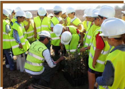
El grupo de escolares es ayudado por el personal de CLC a plantar los árboles

Entre los días 22 y 24 de octubre los alumnos de 5º y 6º de Primaria del Colegio Francisco Giner de los Ríos de La Algaba, visitaron las instalaciones de CLC.