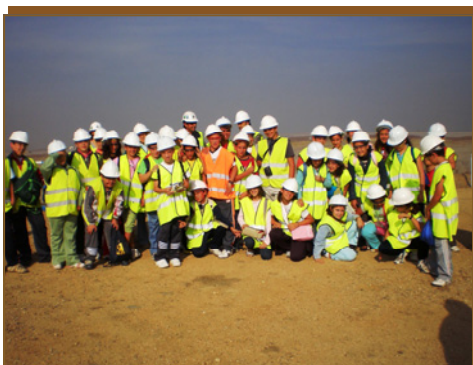
Un momento de la visita dentro del complejo minero.

Un total de 100 niños y 5 profesores de este centro conocen ya en terreno las características de CLC puesto que a la visita a campo, le precedió una charla informativa del proyecto en donde los alumnos pudieron informarse de todas las cuestiones que les interesaban.