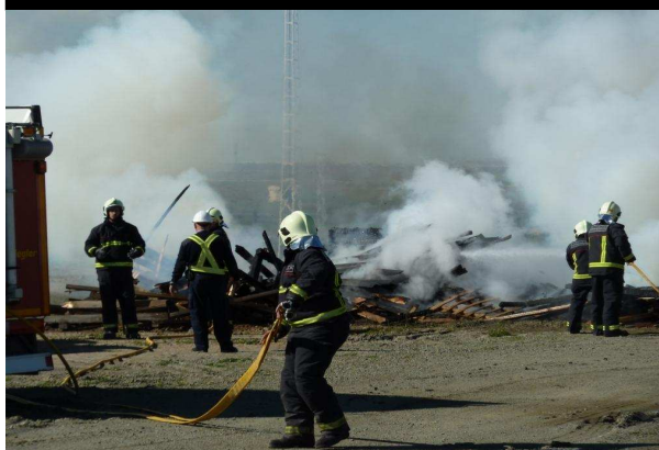
Personal de emergencias extinguiendo un pequeño fuego provocado en el interior del complejo minero.

En ambos casos, CLC contó con la colaboración de trabajadores, personal de seguridad y equipos de emergencia, entre ellos la Policía Local y el Cuerpo de Bomberos de Gerena. Para concluir, se llevó a cabo un análisis de los tiempos de respuesta, flujo de comunicación entre los intervinientes, etc., para valorar la eficacia de la iniciativa, que forma parte de un programa de vigilancia en seguridad cuyo objetivo es estar preparados y saber actuar en cualquier situación que pueda producirse.