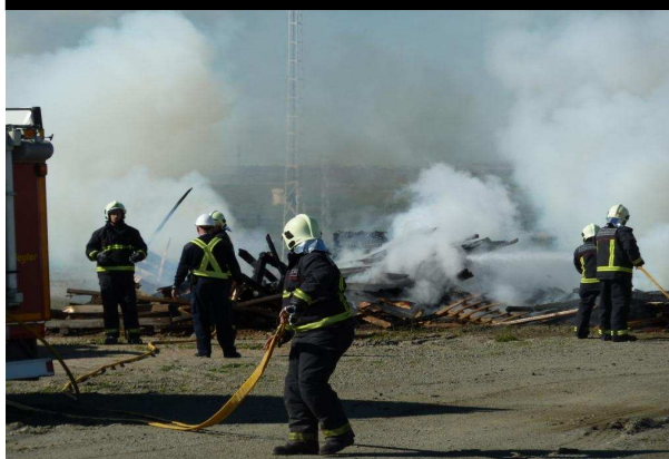
Personal de emergencias extinguiendo un pequeño fuego provocado en el interior del complejo minero.

En ambos casos, CLC contó con la colaboración de trabajadores, personal de seguridad y equipos de emergencia, entre ellos la Policía Local y el Cuerpo de Bomberos de Gerena. Para concluir, se llevó a cabo un análisis de los tiempos de respuesta, flujo de comunicación entre los intervinientes, etc., para valorar la eficacia de la iniciativa, que forma parte de un programa de vigilancia en seguridad cuyo objetivo es estar preparados y saber actuar en cualquier situación que pueda producirse.